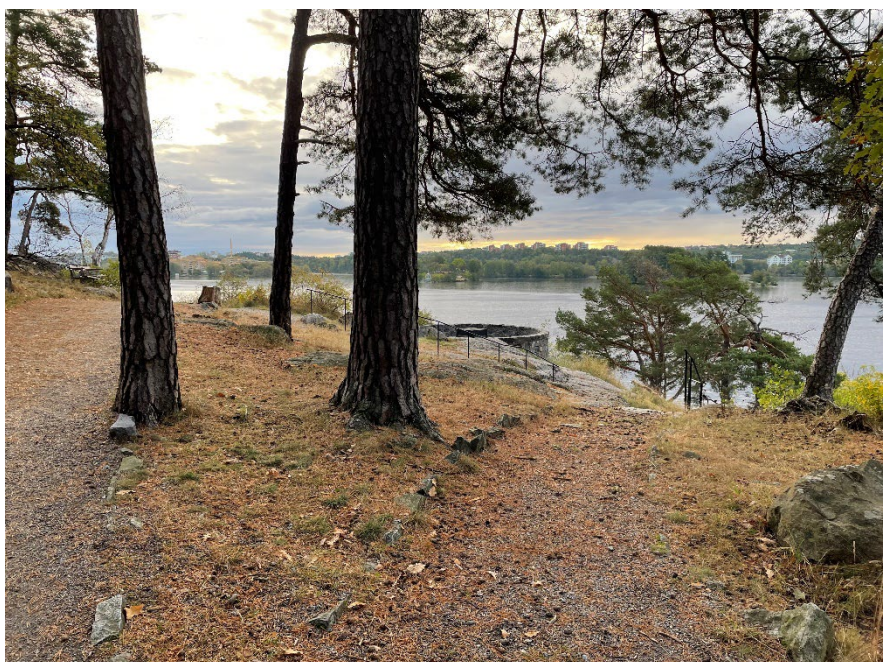
Figur 2. Strandpromenaden i Ålstensskogen erbjuder olika naturupplevelser, lugn och ro men även platser för sociala möten.

Vidare utgör området ett värdefullt och välbesökt rekreatiomsområde som erbjuder god möjlighet till olika naturupplevelser, lugn och ro, sociala möten, motion och lek.