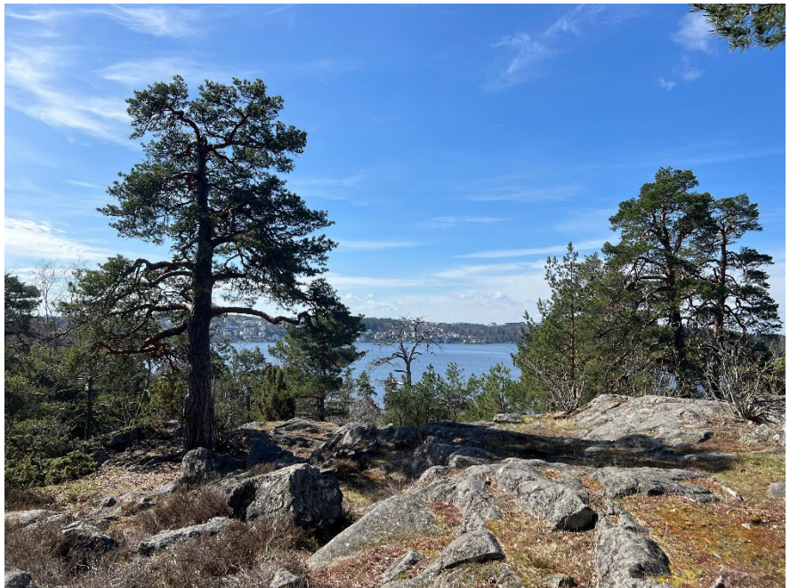
Figur 1. I Ålstensskogen och Storskogen finns värdefulla barrskogsmiljöer med vackra gamla tallar.

Området utgörs även av en kulturhistoriskt värdefull miljö med spår av mänsklig aktivitet från bronsåldern till idag. Vid planering av utbyggnad av trädgårdsstaden bevarades Storskogen och Ålstensskogen som naturparker. Ålstensparken och Ålstensskogen lyftes fram som 1920-talets främsta exempel på denna typ av park.